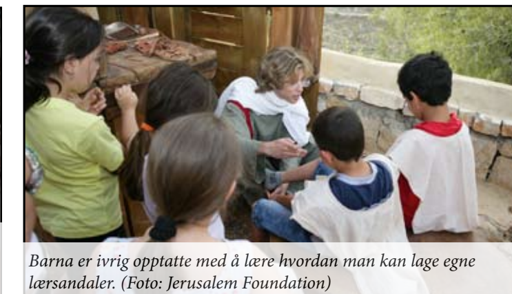
Barna er ivrig opptatte med å lære hvordan man kan lage egne lærersandaler.