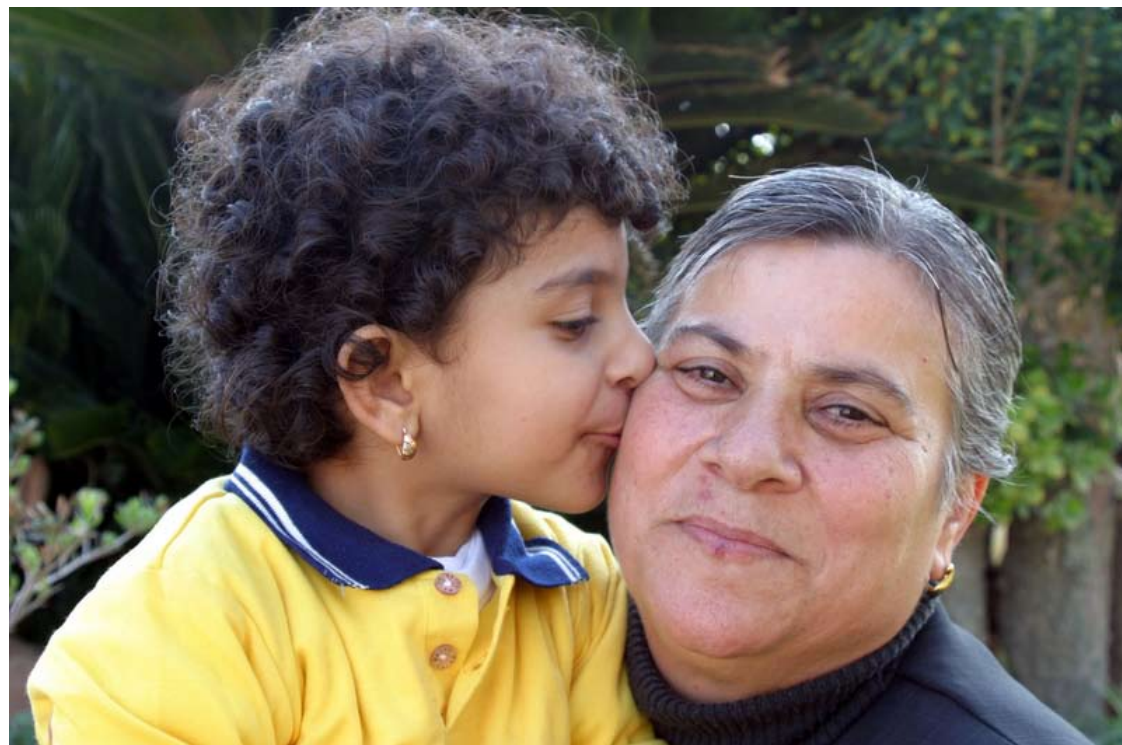
Når far eller mor faller fra, må besteforeldre eller andre slektninger trå til. Da kan hjelp utenfra være helt avgjørende for hvordan det går.

Av alle Israels immigranter er det nok de foreldreløse immigrantbarna som har det aller vanskeligst. Derfor er Fadderbarnprosjektet til Selah (Israel Crisis Management) og HJH så viktig.