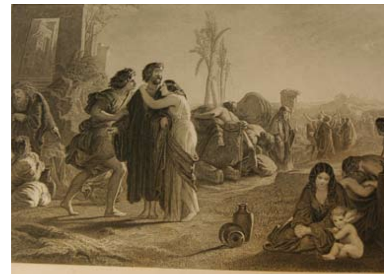
Moses leder Israelfolket ut av Egypt.

Men midt i det heile: Joden er ikke lenger et folk uten land. Og landet er heller ikke uten folk. Det som Gud har sammenføyd, er forgyves prøvd adskilt og oppdelt. Det skrives fortsatt historie. Vi er en del av den. Vi er med på å skrive den. Som enkeltpersoner og som samfunn er vi med på å