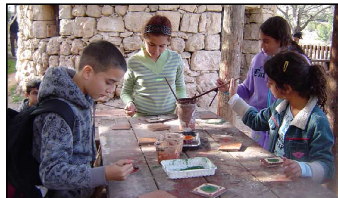
Skolebarn fra hele Israel besøker Ein Yaël hele året. Storinnrykket kommer til sommeren når 120 barn hver dag deltar i ulike aktiviteter over 15 dager fordelt på tre puljer.

Unger som kun opplever asfalt, skolebenk og en trang leilighet hver dag vet ikke hvor melet i pizzaen kommer fra. Ei heller hvordan olivenolje blir til. Vokser varene ut fra butikkhyllene på supermarkedet?