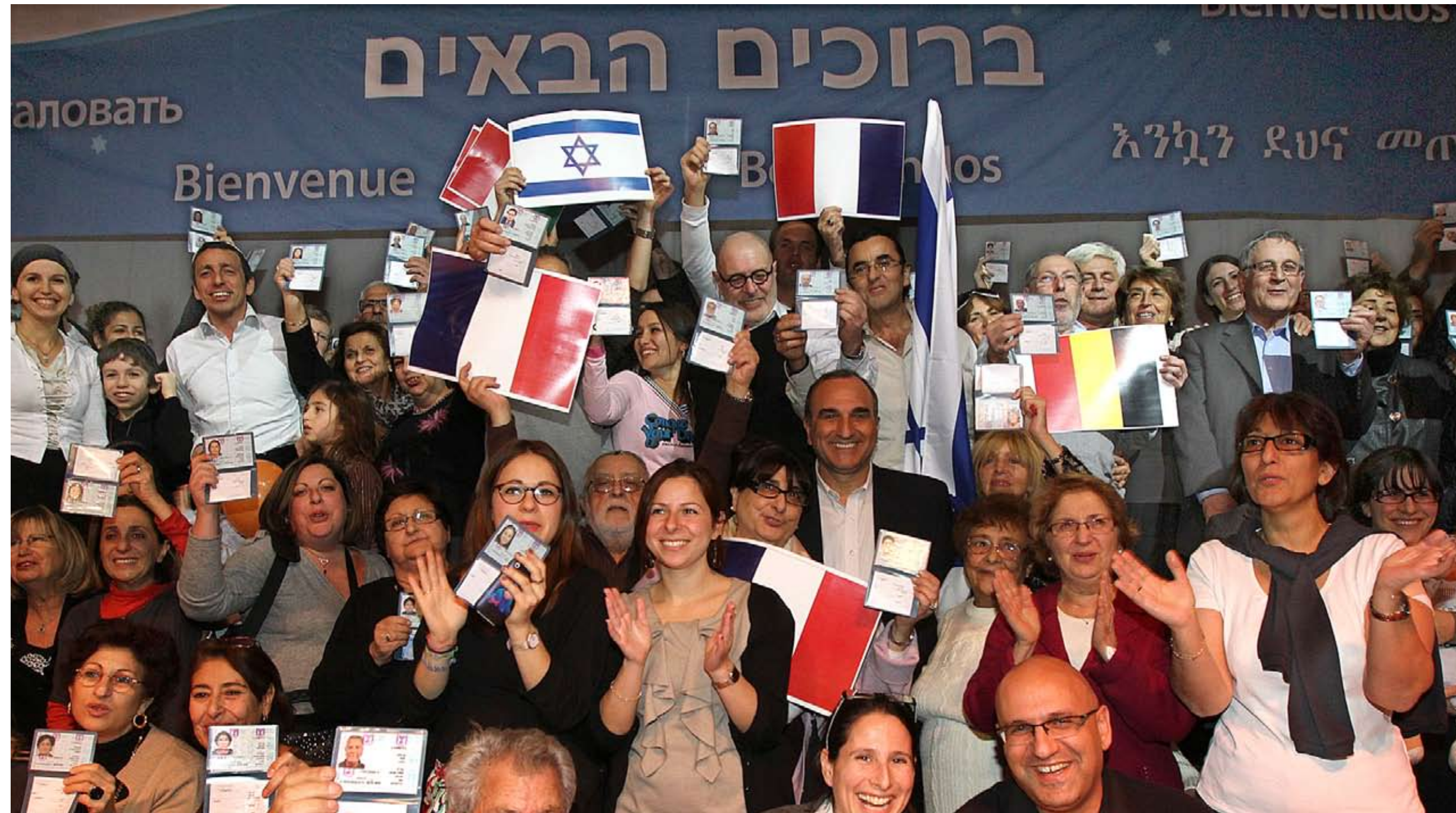
Franske immigranter ankom Ben Gurion 29. desember 2010 og fikk sine israelske identitetspapirer.

Som liten gutt skjedde det noe som på mange måter har preget livet mitt. Jeg gledet meg over å så, å plante og å dyrke fram blomster av ulik slag – i miniveksthuset mitt i barndommens grønne dal. Tante Elisabeth kom ofte på besøk. Hun kikket inn der. –Hva heter den planten der, spurte hun. Pekte på en frodig og grønn slyngplante som krøp langs marka. Med min daværende spede stemme pep jeg: –Det er den vandrende jøde!